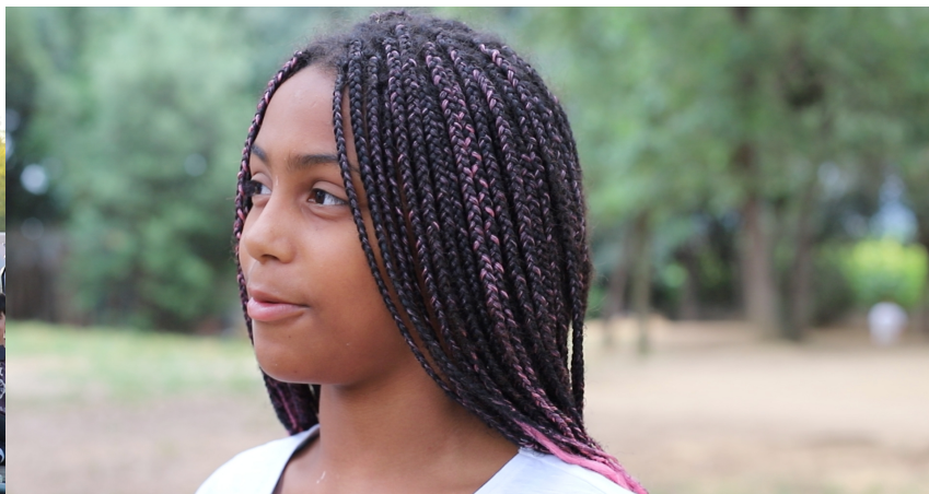
Stills del curt documental "L'essència del Lleure. Un relat a Ciutat Vella"