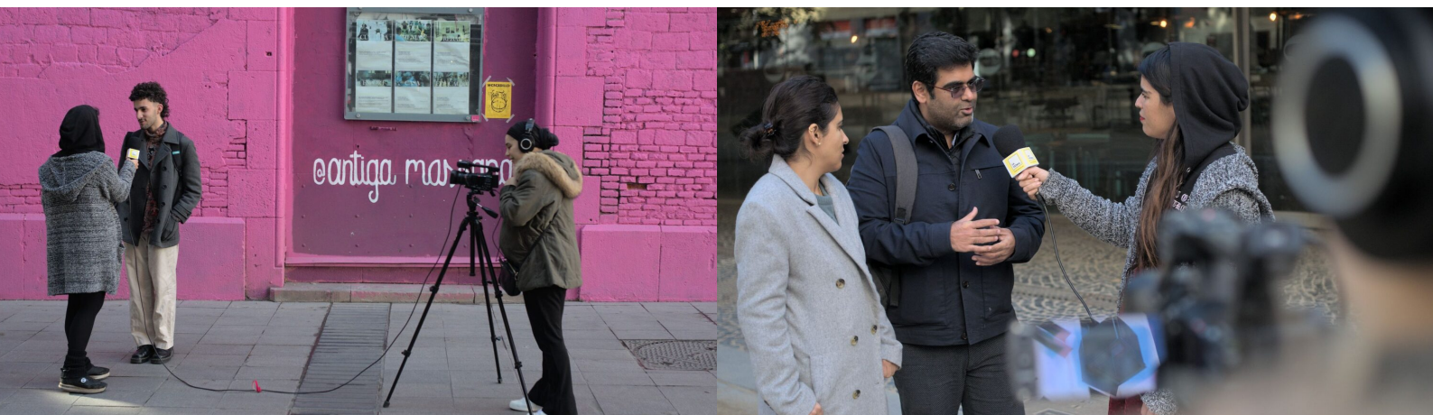
Rodatge del reportatge “Reporteres Ravaleres”

El desembre del 2023 s'ha publicat al web el reportatge "Reporteres Ravaleres" on han participat les primeres veïnes implicades en la ideació, producció i execució dels continguts.