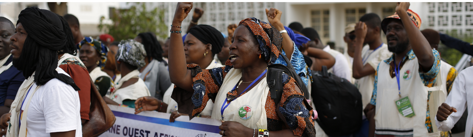
Fotografia de la producció de fotonarratives de la Caravane Ouest Africaine

Coordinació de la producció de fotonarratives de l'esdeveniment “Caravane Ouest Africaine”. Aquesta va tenir lloc entre el 25 d'octubre i el 20 de novembre de 2023 des de Burkina Faso, passant per Costa de Marfil, Mali, Senegal i Gambia. Sota el lema de l'emergència climàtica, amb l'objectiu general de contribuir a intensificar la lluita contra el canvi climàtic mitjançant la sensibilització i la promoció de l'agrecologia camperola com a alternativa a les falses solucions, exercint pressió sobre les comunitats i les autoritats per garantir la sobirania alimentària.