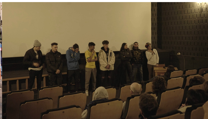
Projecció del documental "Llegará, llegaremos" al Zumzeig