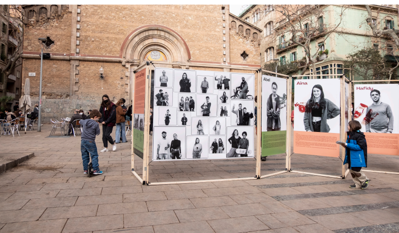
Exposició de "Venim de Lluny" a Santa Perpètua de la Moguda (2020)

El projecte té un compte d'Instagram propi on es poden veure imatges del procés i alguns resultats: @infraexpuestos