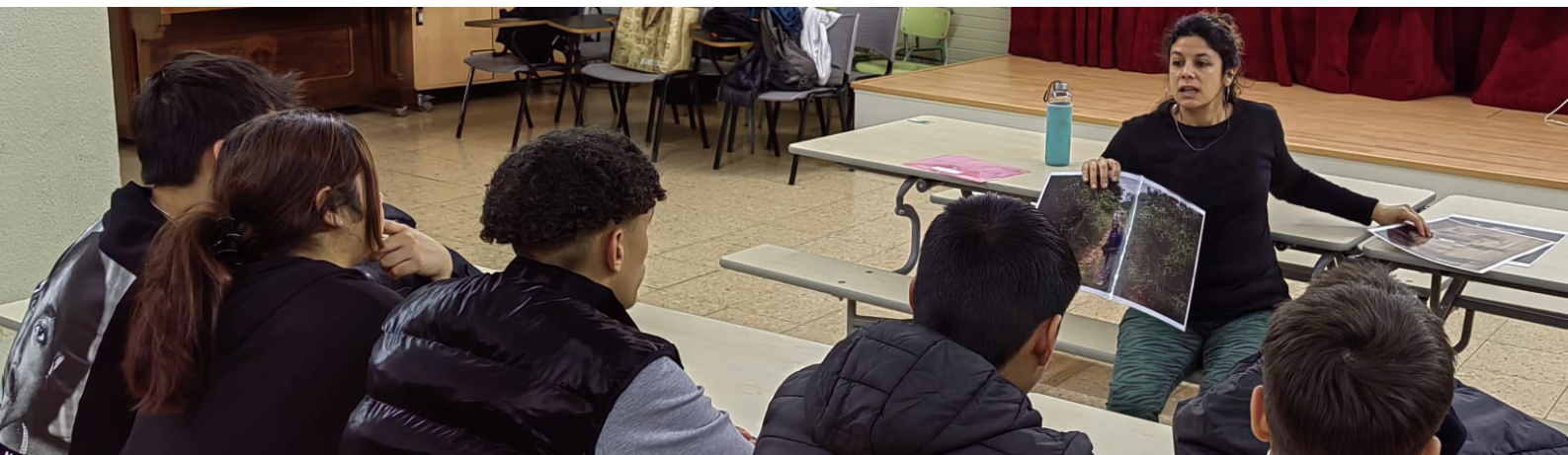
Imatges del taller de sensibilització amb alumnes de secundària

A partir del coneixement i els continguts generats, l'estratègia educativa es concreta en una sèrie d'activitats de sensibilització, formació per contribuir a la millora del coneixement de la ciutadania - especialment de la joventut - per transformar actituds i promoure la defensa dels drets vulnerats.