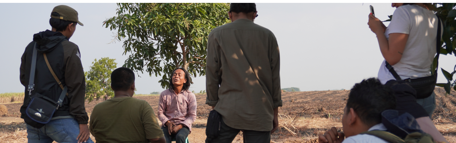
Imatge de Making of del rodatge dels productes visuals participatius

En el taller hi van participar 4 persones formadores i un grup de 15 joves de diferents regions d'Indonèsia. Va consistir en una setmana de treball col·laboratiu i comunitari amb les comunitats camperoles de la zona. De manera participativa, es va fer la ideació i conceptualització dels productes visuals, vam visitar varies zones en conflicte per registrar fotografies, entrevistes i grabar vídeos. Posteriorment, vam dedicar hores a seleccionar, editar i muntar els materials per tenir el resultat final que va permetre crear una campanya de comunicació apropiada amb el seu logotip i lema propi.