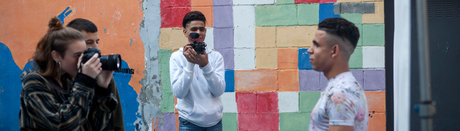
Imatges del taller de retrat fotogràfic amb els joves del grup Infraexpuestos