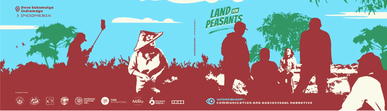
Disseny gràfic del fotollibre de l'experiència del taller participatiu a Indramayu