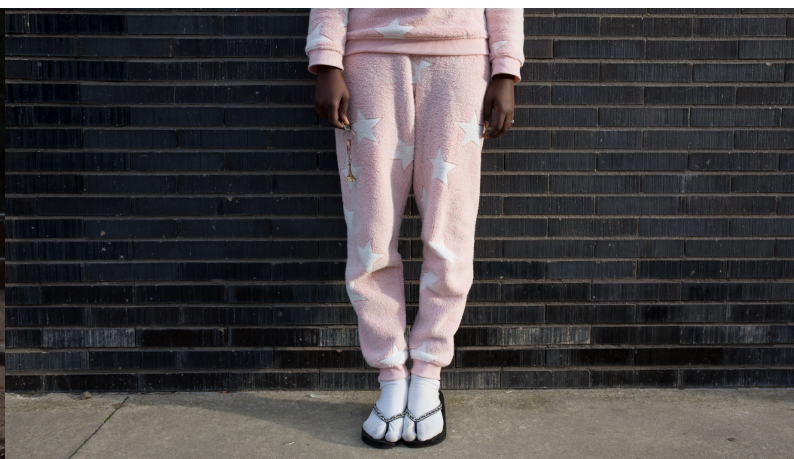
Fotografies pel projecte ReIncluGen