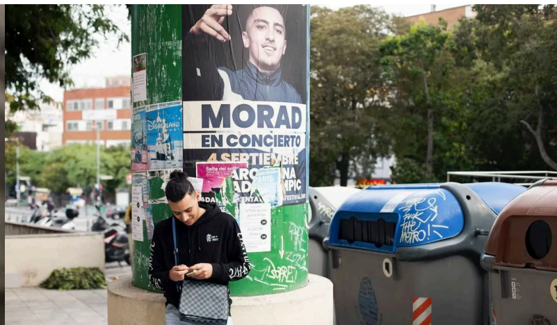
Imatges del fotollibre "14 vides, 1 història"

convivència i vivències migratòries, utilitzant els materials visuals creats fins al moment.