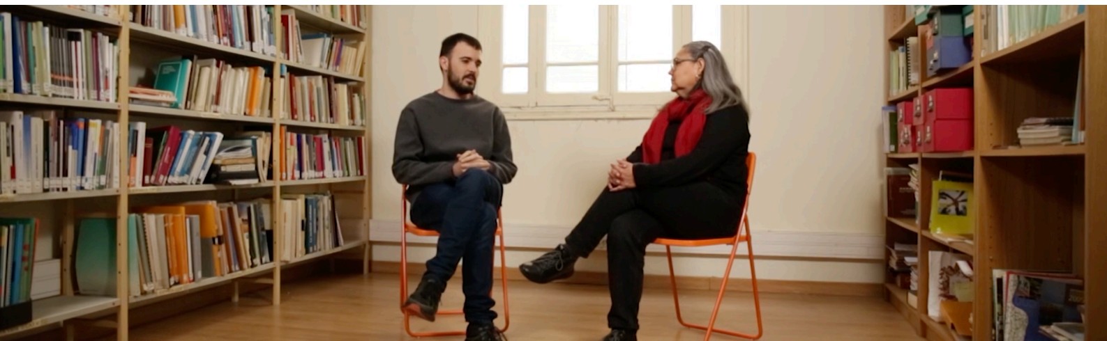
Still del vídeo de la Campanya "20 Anys de Migra Studium"

Realització de la campanya audiovisual per la celebració i commemoració dels 20 anys de la fundació Migra Studium.