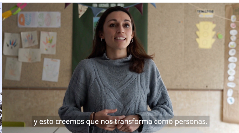
Stills del vídeo de la Campanya “Fer-se càrrec de la realitat”